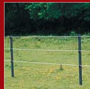
Weidezaun mit Kordel