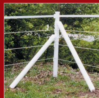
Koppelzaun mit Kordel