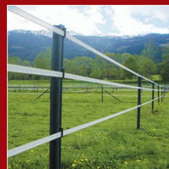
Weidezaun mit Bänder