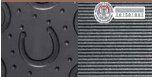
Oberseite: Hufeisenprofil mit Deckschicht