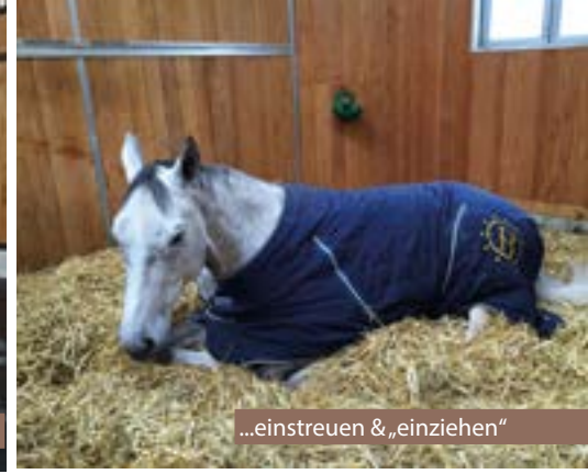
...einstreuen & „einziehen“