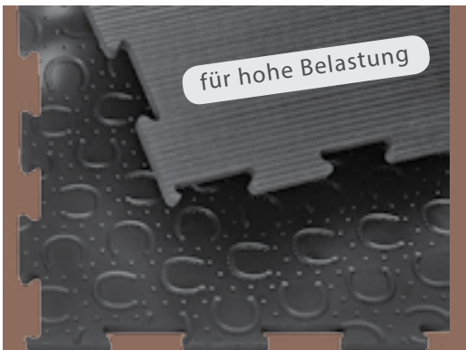
für hohe Belastung