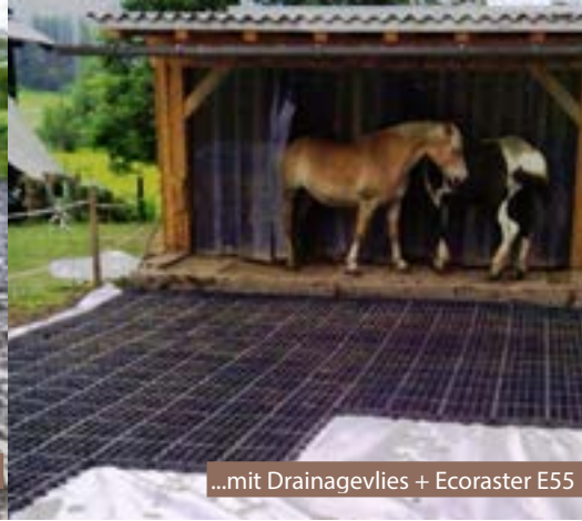
...mit Drainagevlies + Ecoraster E55