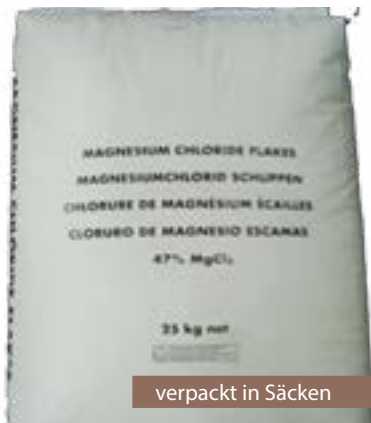
verpackt in Säcken