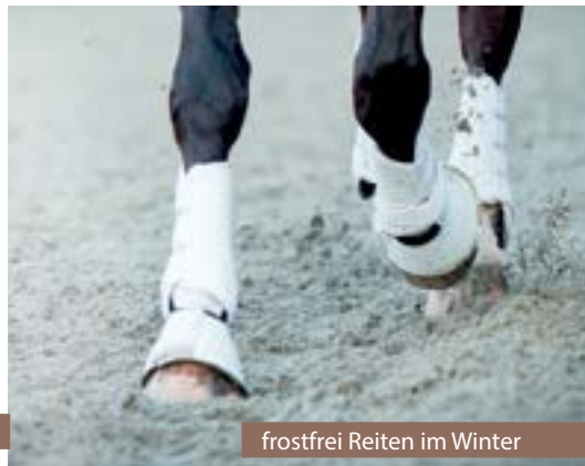
frostfrei Reiten im Winter