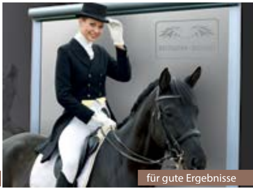
für gute Ergebnisse