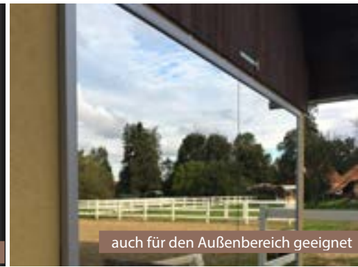
auch für den Außenbereich geeignet