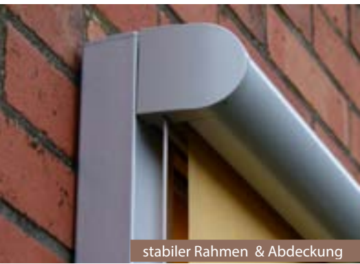
stabiler Rahmen & Abdeckung