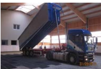
Die Kipphöhe beträgt bis zu 8m.