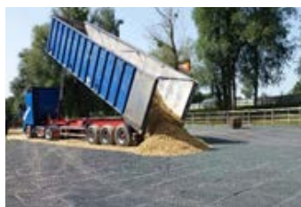
mind. 10 m gerade & ebene Kipfläche